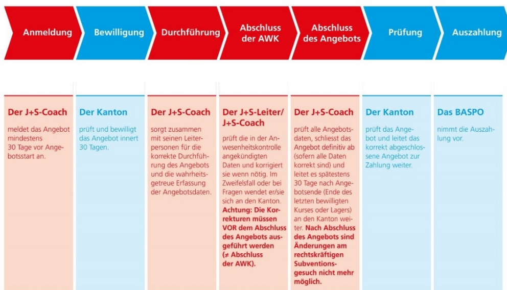
Abb. 1: Prozess J+S-Angebote

Die Bewilligung und die Prüfung von Angeboten der Kantone und der nationalen Sportverbände in der NG4 erfolgt durch das BASPO.